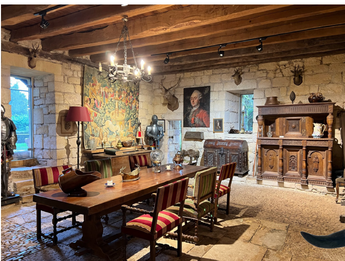
Salle à manger du donjon et manoir la salle

Que vous nourrissiez une passion pour l'art, l'histoire, la nature ou la gastronomie, ces petits itinéraires et bonnes adresses, vous garantiront une immersion au cœur de cette région emblématique de France.