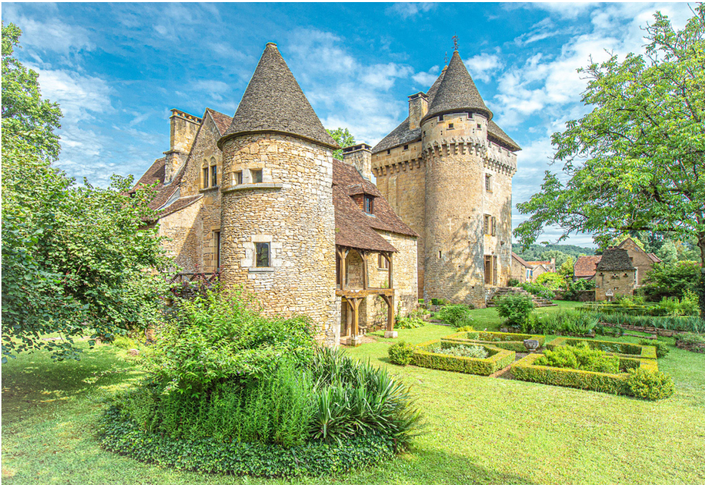
Le Donjon et Manoir de la Salle, Saint-Léon-sur-Vézère